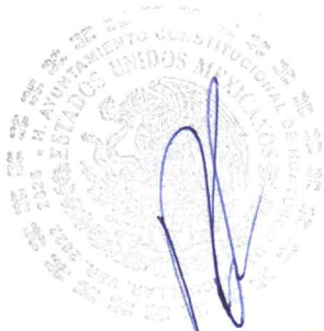
C. VENTURA DEMUNER TORRES PRESIDENTE MUNICIPAL CONSTITUCIONAL

ATENTAMENTE "SUFRAGIO EFECTIVO, NO REELECCIÓN" HUATUSCO, VER 13 DE SEPTIEMBRE DEL 2022